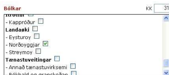
Mynd 6: Vel hvørjum bólum lýsingin skal vísast á

Tað er møguligt at hava ymisk KK alt eftir hvussu høgt tú ynskir at koma inn í tey ymisku støðini.